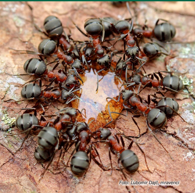
mravenci