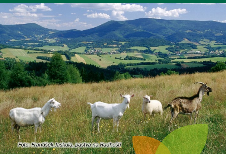
pastva na Radhošti

Náklad: 2 000 ks / ISBN: 978-80-88076-52-0